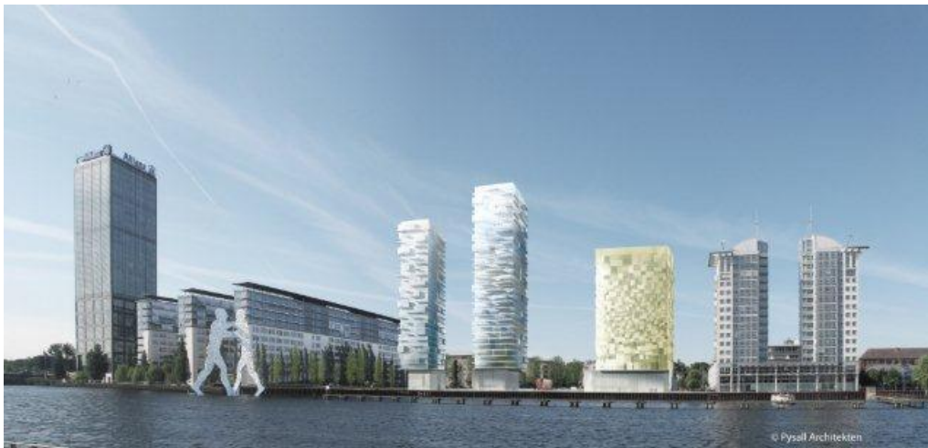
Ergänzt die vorhandene Bebauung harmonisch: der Siegerentwurf des Architekturwettbewerbs für die Fanny-Zobel-Straße aus der Feder von Pysall Architekten (© Pysall Architekten)

Auf einem rund 7.000 m 2 großen Grundstück zwischen den Projektentwicklungen Treptower und TwinTowers realisiert die Agromex GmbH & Co. KG eine Wohn- und Hotelnutzung mit einer oberirdischen Geschossfläche von rund 39.000 m 2 . Nach den Entwürfen von Pysall Architekten, die im Juni 2012 als Sieger aus einem internationalen Architekturwettbewerb hervorgegangen sind, entstehen drei solitäre Neubauten, die die bestehende Bebauung komplettieren und eine Weiterentwicklung der vorhandenen städtebaulichen Strukturen bilden.